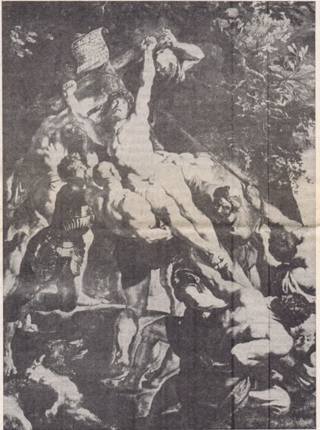
Rubens: A kereszt felállítása. 1610-11. Antwerpen, Dóm.

Közben halmozódtak az egyházi és világi előkelőségek megbízásai: oltárképek, mithológiai jelenetek és arcképek. 1611-ben festette az antwerpeni dóm világhírű «Keresztlevétel»-ét, mely a második világháborúban tűz martaléka lett, majd további antwerpeni oltárképeit, melyeknek egyrésze szintén hasonló sorsra jutott.