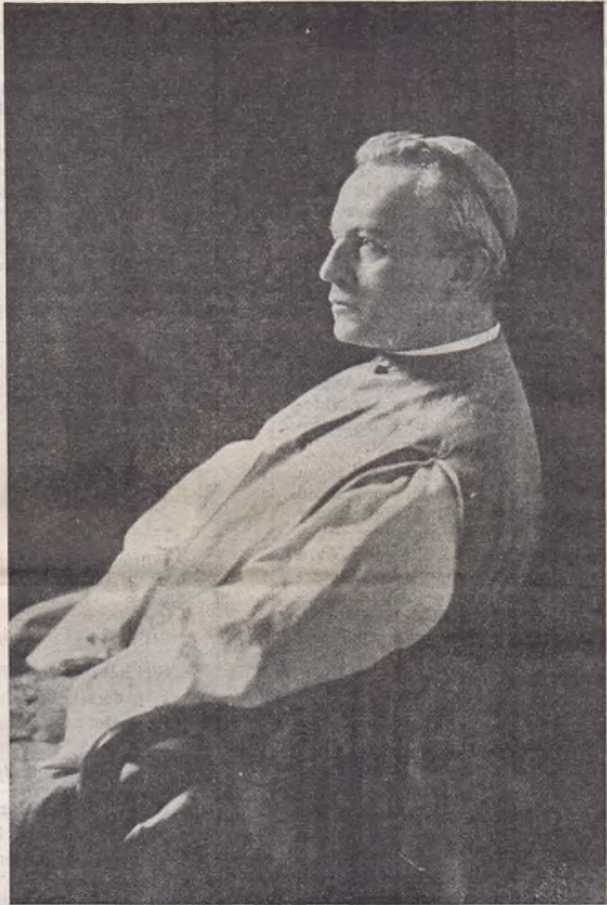
Prohászka 1911 elején

tában volt ennek, bizonyítja gróf Tisza István egyik nyilatkozatára adott rögtönzése. Tisza azt mondta: «Homo sum et nihil humani puto a me alienum».