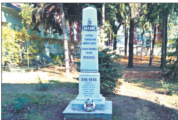
A nagykikindai emlékmű