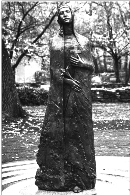
Szent Margit új szobra a budapesti Margit-szigeten

Nem véletlen, hogy miért éppen itt kapott új szobrot a szent életű királylány. Maga a sziget is róla kapta a nevét, hiszen IV. Béla királyunk leánya itt élt, a