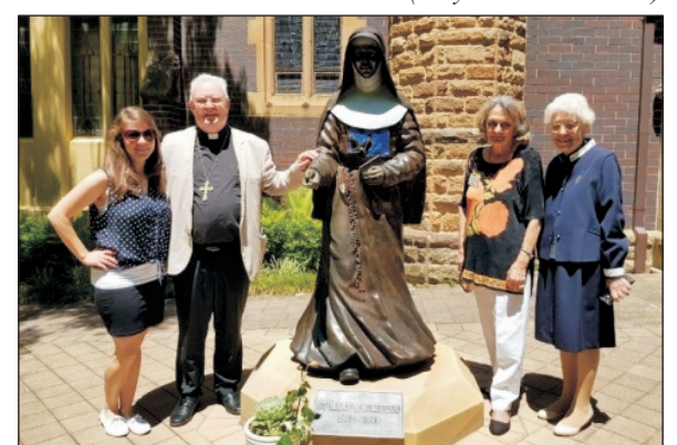
Mary MacKillop szobránál Sydney-ben