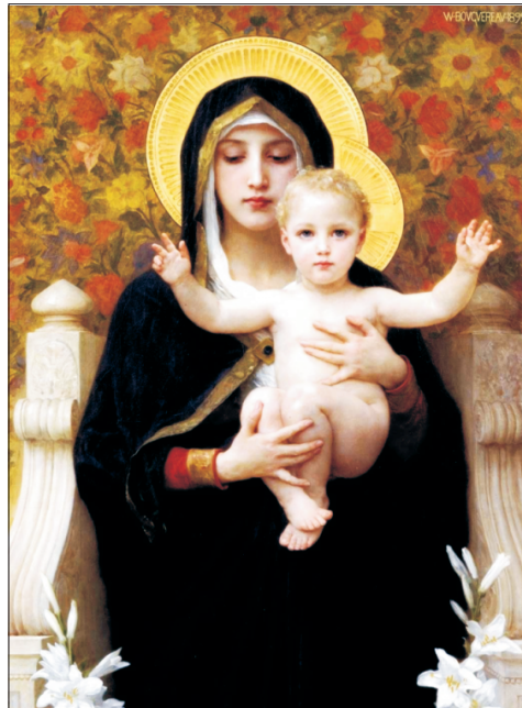
Isten Anyja, a Boldogságos Szűz Mária (Ünnepe: január 1.)

A Boldogságos Szűz – akit nyelvünk nem egyszerűen szentnek, hanem Szentségesnek mond – a legnagyobb a szentek között, mert neki adatott az a kegyelem, hogy anyja lett a megtetsült Igének. Míg a szentek az Úr Krisztus teljességéből merítik az állapotukhoz szükséges kegyelmeket, addig a Boldogságos Szűz ugyanebből a Forrásból megkapott minden kegyelmet, amit teremtmény egyáltalán kaphat: ő a „kegyelemmel teljes”. Szűz anyasága öröktől fogva ott volt Isten megváltó tervében, s amikor elérkezett az idők teljessége, megtörtént az, ami a természet rendjében sem azelőtt, sem azóta nem fordult elő: anya lett a szűz és fia született: Jézus, a mi Megváltónk.