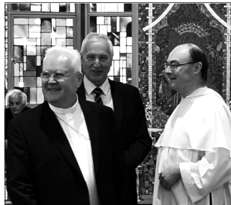
Laurence Foot OP köszöntötte a külföldön élő magyarok püspökét

Krisztus evangéliumi tanítása őszinte és igaz vallásosságot kíván, amint ezt Jézus sürgette – hangsúlyozta Cserháti Ferenc, majd a szentmise végén átadta az Ausztráliában élő magyar hívek számára Erdő Péter bíboros meghívását a 2020-ban Budapesten megrendezendő Nemzetközi Eucharisztikus Kongresszusra.