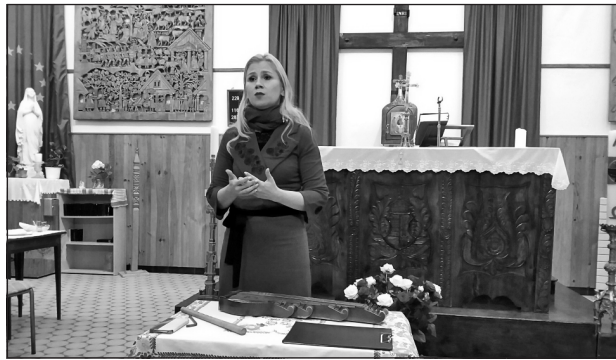
Kovács Nóri imákat is énekelt a Sík-versek között

hitoktatás támogatásával, liturgikus eszközök beszerzésével, előadások szervezésével, művészeti-kulturális programok közvetítésével és egyéb módokon támogassa a diaszpórában élő magyar katolikus közösségek anyanyelvi hitéletét, vallásgyakorlását. Ezt követően lépett a közönség elé Kovács Nóri énekes, dalszerző, Magyar Kultúraért-díjas és Nemzeti Értékként elismert előadóművész az alkalomra összeállított, mintegy háromnegyedórás, Sík Sándor szellemiségéhez