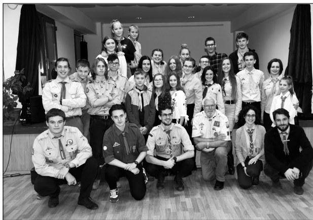
Lehet, hogy valami elkezdődött?

Párizs, Genf – bejárása után a Sík Sándor-emlékfélév az ő községükben zárul, és azért is, mert az esemény rendkívüli és mindmáig példátlan alkalmat nyújtott arra, hogy három, Sík Sándor nevét viselő cserkészcsapat, a budapesti, a szombathelyi és a tardoskeddi találkozzék egymással és közös programban vegyen részt. A házigazda csapatparancsnok megemlégette azt is: felemelő érzés, hogy rendezvé-