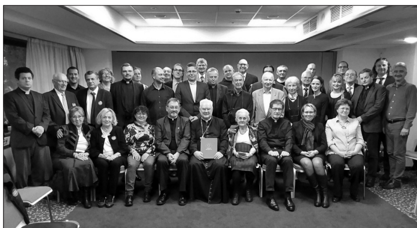
A diaszpóra közösségei hálásak az 1 Plusz 1 Misszió programért

és dicsőítésére a hullámok között vergődő hajóban, az egyházközösségekben. Rendkívényeink irányuljanak a hit megerősítésére és a közösség építésre. Az Úr hajójában a tanítványok közösségének küzdelme csak az után lett sikeres, hogy felismerték az Urat és leborulva imádták Őt.” Legyünk tudatában annak, hogy