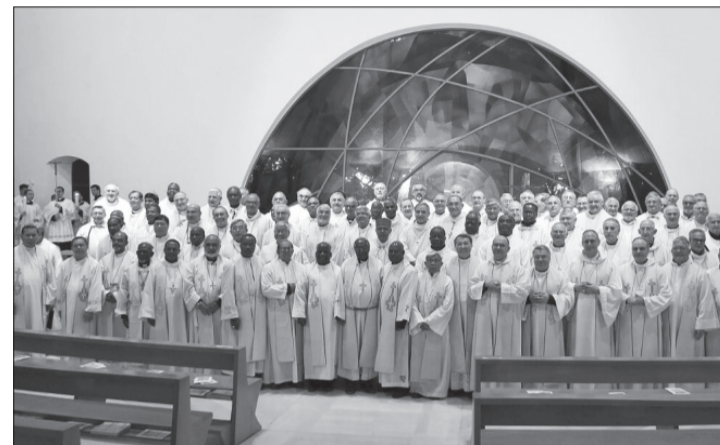
A főpásztorok az egység szép példáját mutatták

Nehéz lenne összefoglalni mindazt a tapasztalatot és teendőt, amelyre a találkozó felhívta a figyelmet. Az égető problémák – háborúk, az elesettek helyzete, szegénység – és azok kezelése, amelyek a tanúságtételekben elhangzottak, rávilágítanak arra, hogy a megoldást közösen keresse mindenki, és az egységet, a békét a párbeszéd és a közeledésen keresztül találja meg.