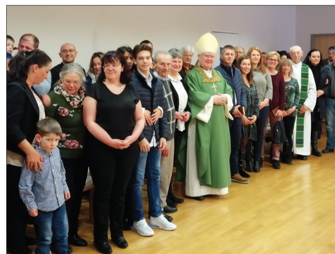
A hívek mindig erőt merítenek a főpástorral való találkozásból

A külföldi magyarok lelkipásztori ellátásával megbízott esztergom-budapesti segédpüspök 2020. február 23-án missziós látogatást tett a németországi Frankfurt am Main és Giessen városában a Szent Erzsébet Magyar Katolikus Egyházközség közösségeinél.