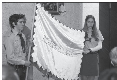
Alapítójuk örökségét ma is őrzik a frankfurti cserkészek

A külföldi magyarok lelkipásztori ellátásával megbízott esztergom-budapesti segédpüspök február 23-án, vasárnap délelőtt Giessenben celebrált szentmisét, mintegy ötven hívő jelen-