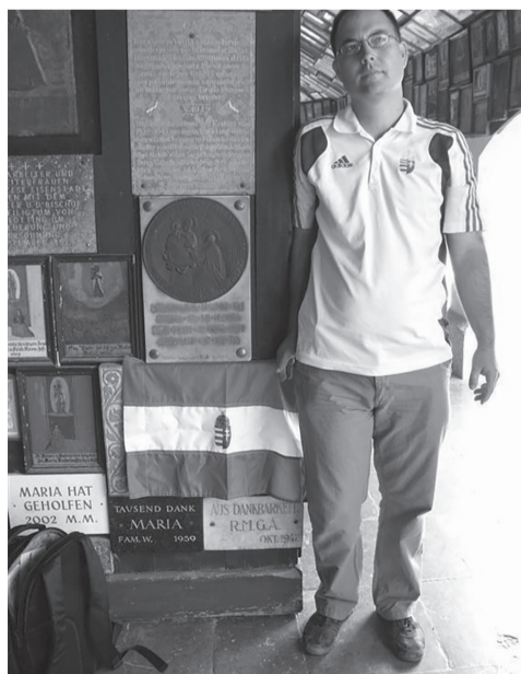
A szerző a magyar emléktábla előtt