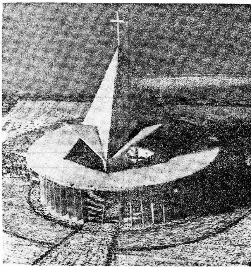
Az épülő templom tervrajza

Az Úr házában kicsinyített képmása szavak nélkül is hirdeti a gondolatot: «Az Ige testté lett és közöttünk lakott». A teremtő szellem láthatatlan, de a művében ő maga nyilatkozik meg látható formában is. A teremtett világ egyenletes körforgásban egy teljes-egész: univerzum, kozmosz, rend. Az egész fizikai világrend «Isten háza». A látható műveiből ismeri fel az emberi ész az Ő láthatatlan létét s mindenható erejét. Kijelentéséből pedig tudjuk, hogy Ő három Személy egyetlen isteni-szellemi természetben. A világot — s abban különösen az embert — a saját képmására alkotta. Az anyag belsőjében mindenütt felfedeztük az egyenlőoldalú háromszöget. Hat ilyen háromszög egy szabályos hat-