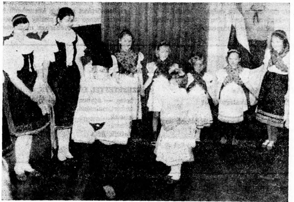
Magyar gyermekek hollóköi és tardi népviseletben.

A külföldi Magyar Cserkész Szövetségnek közel 2.000 tagja van és életképességét leginkább az mutatja, hogy egyedül a múlt évben 10 csapat alakult.