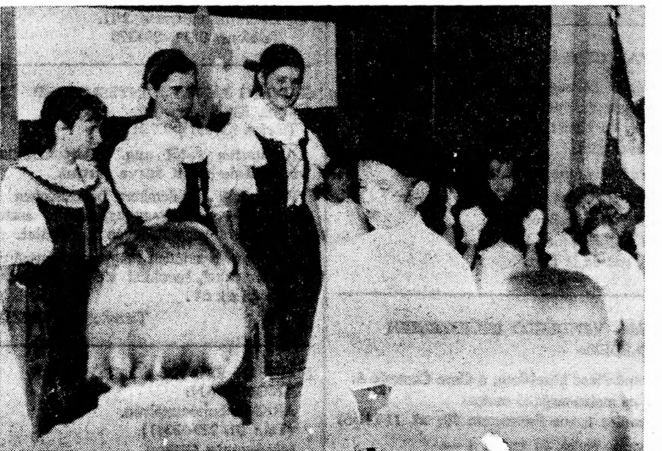
Jelenet az «Egyszer egy királyfi» gyermekjátékból.