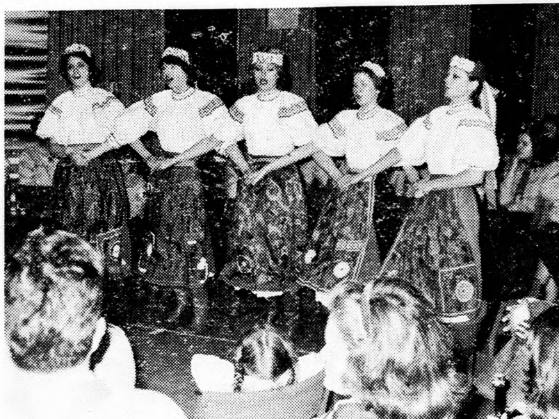
Leánycserkészek népi tánca