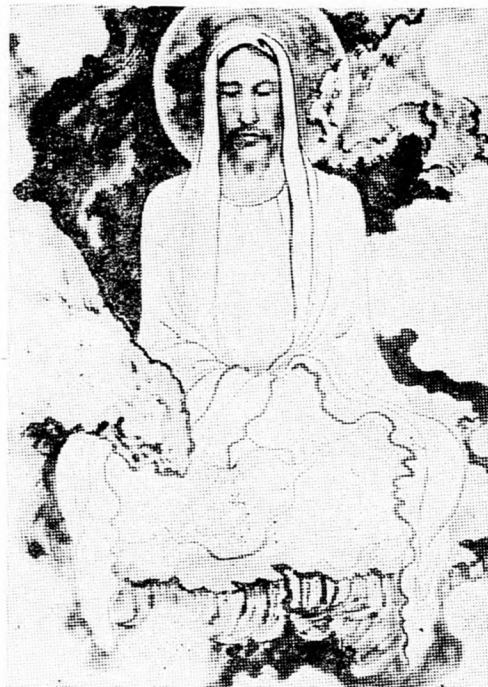
A meditáló Jézus

A nagy keleti vallásrendszerekben Mongóliától Dél-Indiáig mindenütt előfordul a mantrázás. A „mantra” az imának vagy Isten dicsőítésének hindu elnevezése. A szó mindenekelőtt varázsos formulát jelent, és a késői hinduizmusban a mantra bizonyos rituális szerepet kap: szövegtöredékeket vagy recitálnak vagy mormolnak vagy hallgatva átgondolnak, de utóbbi esetben is mindig olyan ki- és belélegzéssel, mint a beszédnél. A mantra szavainak ér-