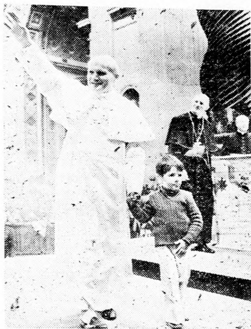
II. JÁNOS PÁL PÁPA MEXIKÓI DIADALÚTJÁN

szünök meg, mint hirdetője az örömhírek, az egész emberiségnek ezt ismételni: Ne féljétek! Tárjátok ki a kapukat szélesre, egészen szélesre, Krisztus számára. Tárjátok föl az Ő megváltó hatalma előtt. Táruljanak ki előtte