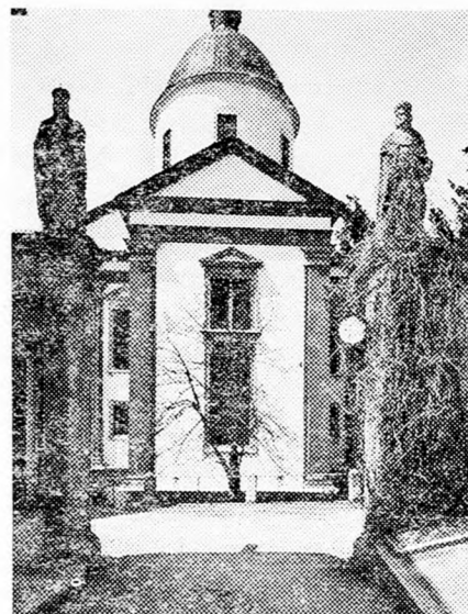
Máriacell: a templomudvar keleti „magyar” kapuja Szent István király és Szent Imre szobraival. Régen ezen a kapun érkeztek a magyarországi zarándokok

A kegyhely igazi fénykora azonban csak a reformáció zavaros korszaka után kezdődik s a katolikus megújulás idején bontakozott ki. Máriacell növekvő népszerűsége, a mind gyakoribbá váló tömeges zarándoklatok tették szükségessé a középkori gótikus templom 17. sz.-i átépítését és tetemes kibővítését.