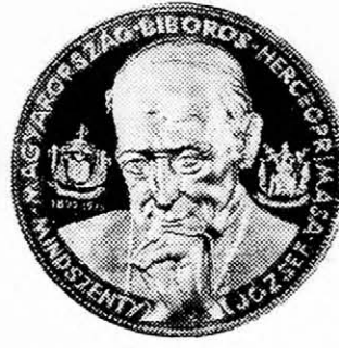
VI. Sorozat előoldal