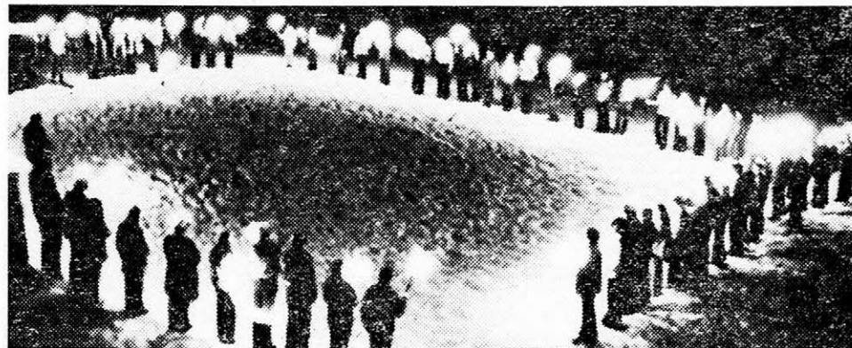
Fáklyás cserkészek köszöntik az Újévet Dél-tiroiban a magyar Himnusz-szal.