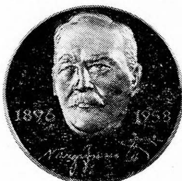
III. Sorozat előoldal

Az érmék technikai adatai: átmérőjük 38 mm, súlyuk kb. 24 gr., bronzból patinával borított, a DM 25.-; 22 karátos színezüstből védjegyzve, PP-minőségű (polirozva) a DM 75.- MWST. nélkül. Aranyból jelenleg nincsen kivitelezési lehetőségünk. Megrendelhető: NUMISMATICA HUNGARICA, Postfach 73-0302, D-6000 Frankfurt/M-73, West Germany.