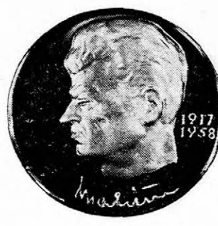
IV. Sorozat előoldal