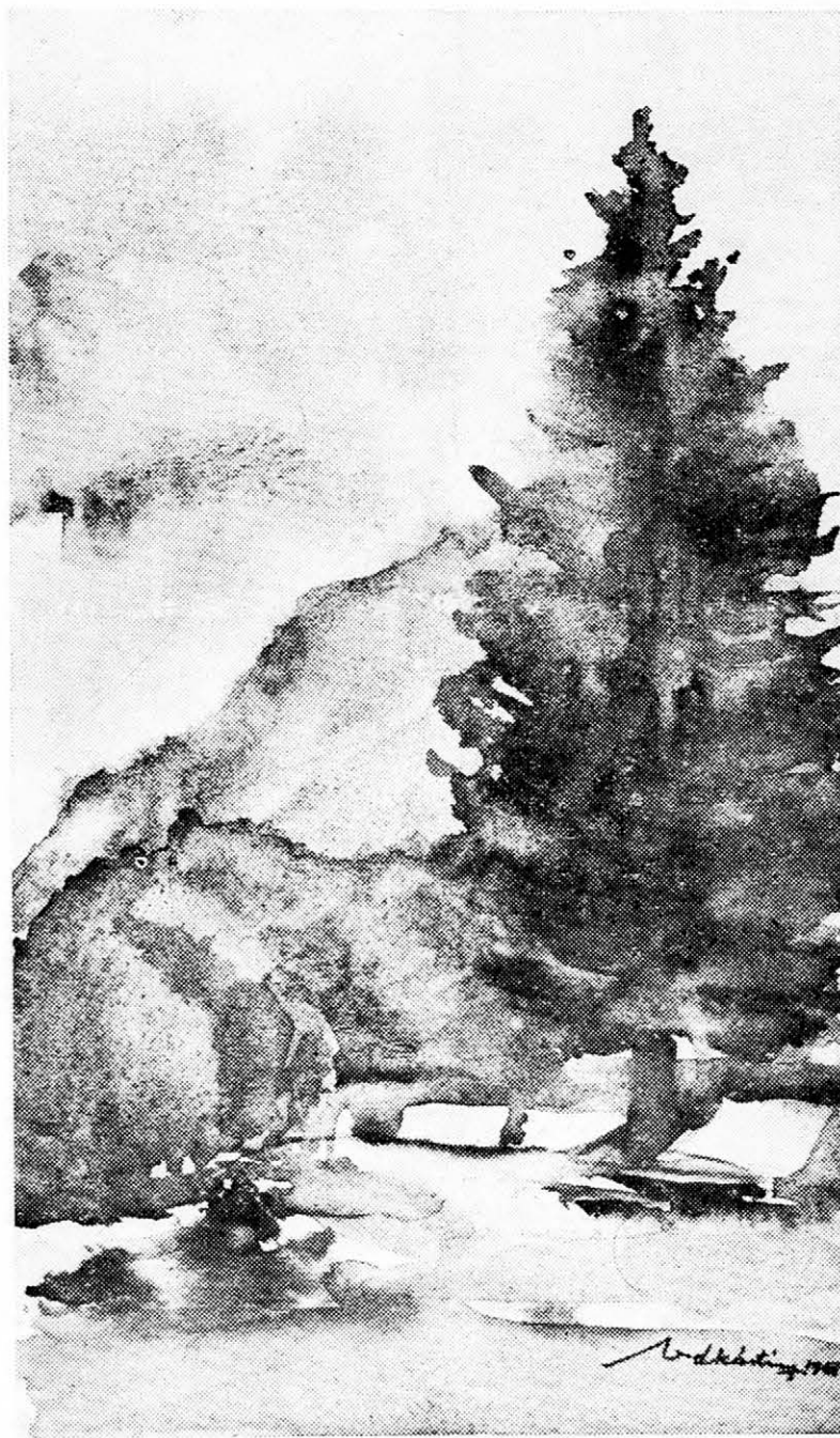
MAGÁNYOS CSÍKI FENYŐ