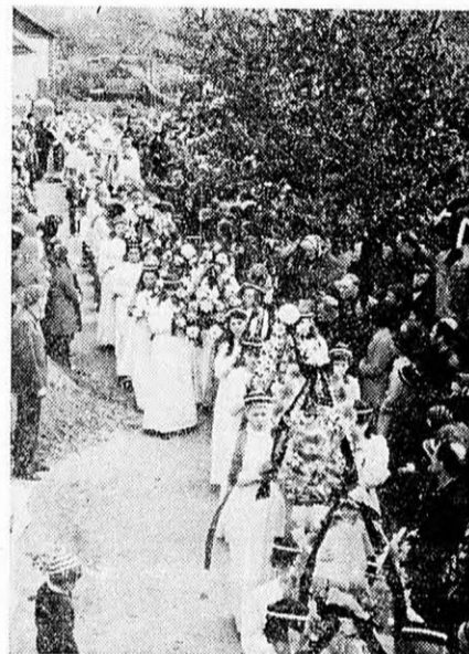
Hira Sándor püspök temetése

ketné — ami lehetetlen — én nem felejtelek el benneteket.