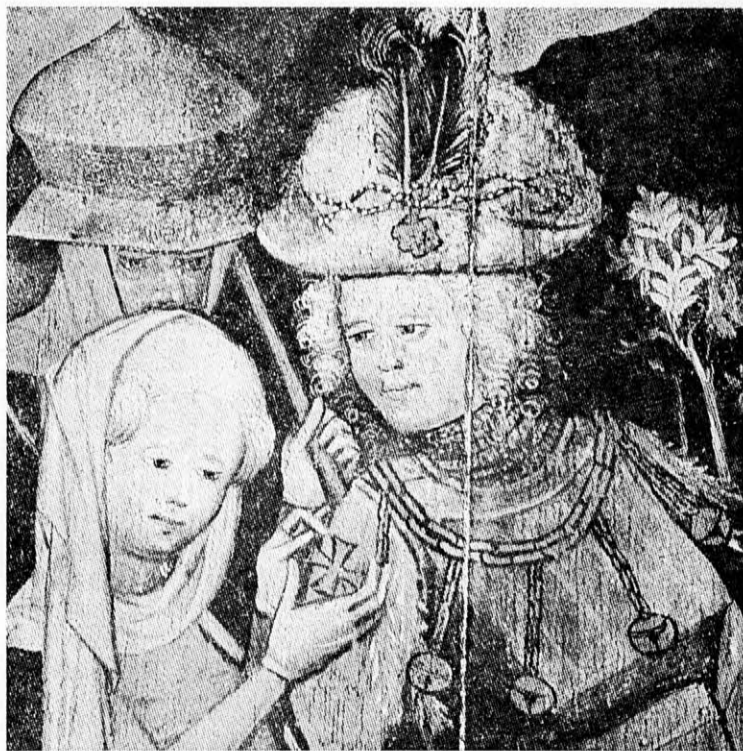
Szent Erzsébet feltűzi a keresztetna Szentföldre induló férje mellé Szentlélek-kórház, Lübeck, 1420

A kiemelkedő istentiszteletek sorát az Erzsébet-templomban a templomszentelés 700. napján rendezett ünnepség nyitotta meg. Jung evangélikus püspök prédikációja, a liturgia ünnepi érzéseket kiváltó rendje mellett a templom kórusa énekelte annak a majd ezeréves templomszentelési liturgiának szövegrészeit, amelyek valamikor az Erzsébet-templom felszentelése alkalmával is szerepeltek. A Szentírásnak a Titkos Jelenések könyvéből vett része az Egyház jövője sorsára utalnak, az istenellenes hatalmakkal vívott küzdelmére és arra, hogy keresztútja győzelmeken keresztül vezet az örök dicsőség végső d'adalára. A szövegrészeket az évszázadok során több zeneszerző zenésítette meg, ezúttal Palesztrina, Bruckner, Brahms, Weyer kompozíciói hangzottak el.