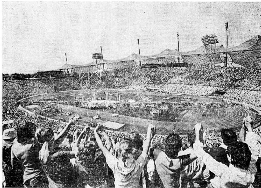
A NÉMET KATOLIKUS NAPOK MÜNCHENBEN (1984 JÚLIUS 4 – 8)

meivel, meg a diplomáciai sikereivel és most — Uram bocsá... — leprásokat megy ápolni Afrikába. Fölcsap utcasarki prédikátornak, hitbuzgalmi újságot osztogat a templomajtóban. Az anyja hiába ájul el előtte, mégis becsapja maga mögött a kolostorajtót. Az apja káromkodva kitagadja, csak bezárkózik élete végéig a szűk cella félhomályába. Kegyes főnöke keze idegesen reszket, szeme szikrát szór, áthelyezéssel fenyegeti. Ám ő határozottan