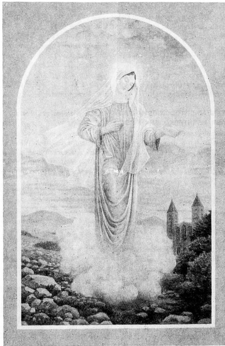
A MEDJUGORJEI SZŰZ MÁRIA

Az enciklika elsősorban lelkipásztori célokat szolgál. Bár nem hagyja ki az egyházi tanítás csúcspontjait, amelyek a kétezzer év alatt kikristályosodtak: Mária szüzessége, istenanyasága, az eredeti büntől való megszabadítása és mennybe való felvétele többek között. Ezeket túlmenően a 121 oldalas írás