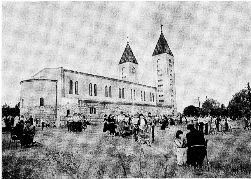
A Medjugorje-i templom, gyónókkal a szabadban