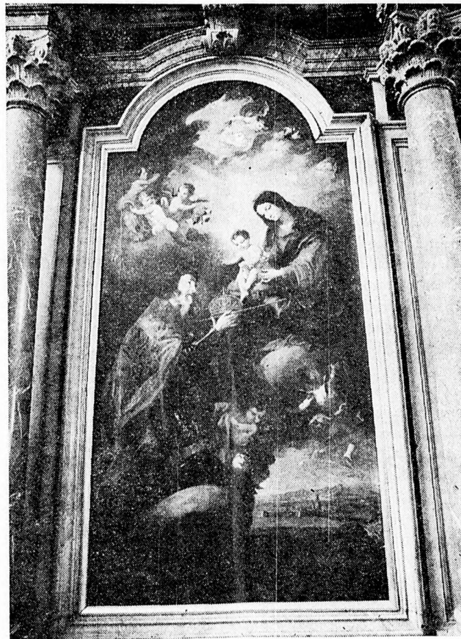
ISTVÁN KIRÁLY FELAJÁNLIJA A KORONÁT

Bensőséges lelki életet élő emberek sokszor képesek előre megérezni halálukat. István is ebből a fajtából való volt. Mint a Nagyobb Legenda írja, „egész