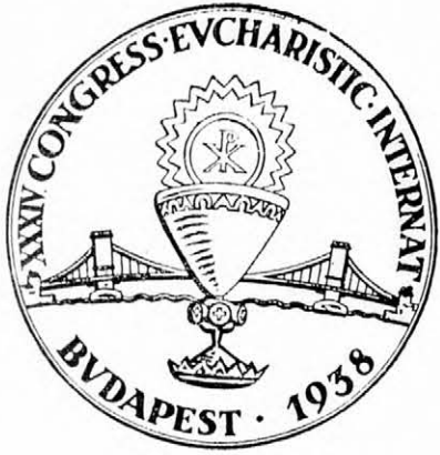
A kongresszus emblémája