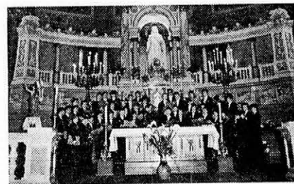
A Szent István bazilikában

— a „dómverebek” Hans Leo Hassler „Missa octo vocum” című miséjét énekeltek. A szentmise végén (a pannonhalmi két koncert zárószámaként is) a bajor gyermekkórus magyarul énekelte az „Ah, hol vagy magyarok tündöklő csillaga” kezdetű kórusművet Kodály Zoltán feldolgozásában. A bazilikát betöltő hívek könnyes szemmel hallgatták a művészi előadást, amelyért Paskai prímás úr zárószavaiban külön köszönetet mondott a kórusnak. A prímás emlékeztetett a Bajorországgal és kiemelten Regensburggal fennálló ezeréves magyar kapcsolatokra: Szent Wolfgang, az első nagy hittérítő a pogány magyarság körében; a kalandozó Bulcsú vezér Regensburg bitófáján lelte halálát; a keletnyugati kereskedelmi főútnak Székesfehérvár, Esztergom és Regensburg voltak a legfontosabb állomásai, stb.