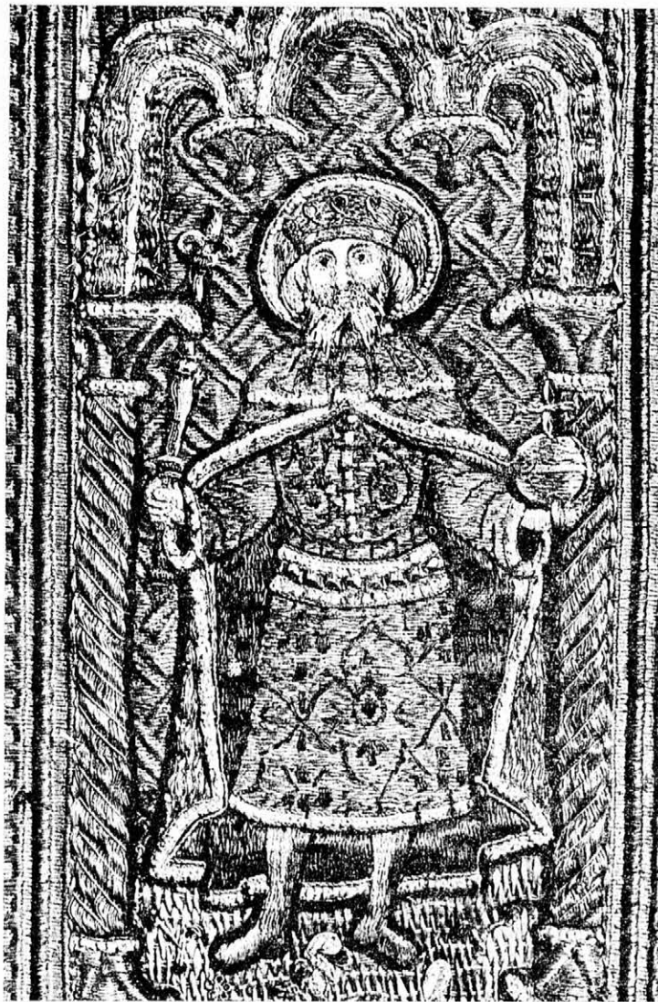
SZENT ISTVÁN KIRÁLY ALAKJA EGY RÉGI MAGYAR MISERUMIÁN (részlet) 1470 körül. Esztergom, Főszékesegyházi Kincstár. (Bogyay Tamás: „Stephanus rex” c. könyvből)

ziója van: történelmi visszapillantás, az ünnep lelkületének elmélyítése a közösségben és annak érvényesülése egyéni életünkben. Ez a megállapítás különleges mondanivalóval rendelkezik, ha István király egyéniségében nemcsak a nemzet atyját, hanem a magyar családok példaképét is látjuk. Az elmúlt negyven év alatt biztosan nem érte olyan nagy kár társadalmunk egyik sejtjét sem, mint