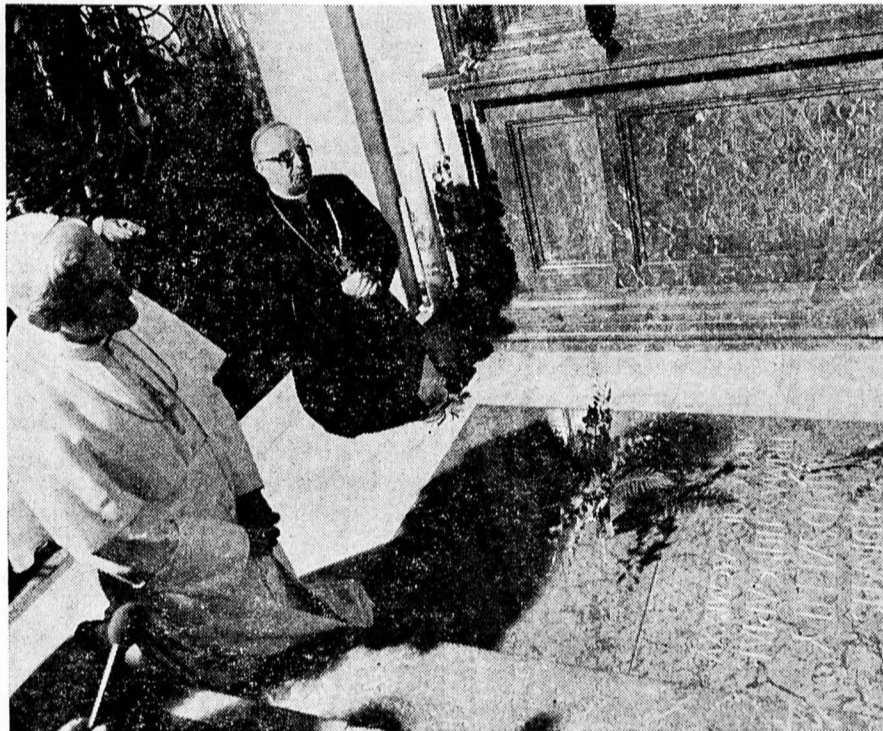
II. JÁNOS PÁL PÁPA MINDSZENTY MÁRIACELLI SIRJÁNÁL. (1983.)

A borongós hideg idő ellenére május 4-én mintegy százezer hívő zarándok érkezett Esztergomba az ország minden