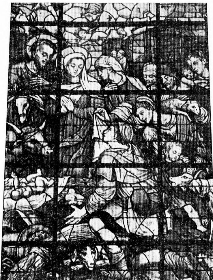
A PÁSZTOROK BETLEHEMBEN

Bűnös, önző volt az a világ is, amikor a földre lépett. De Mária szíve telve volt Isten és ember szeretettel! József szíve telve volt a mennyei Atya iránti tökéletes engedelmességgel. Nem akartak mást, mint amit az Atya! Minden külső körülmény ellenére is a szívükben béke volt. Csak Jézusra gondoltak, csak Érte éltek.