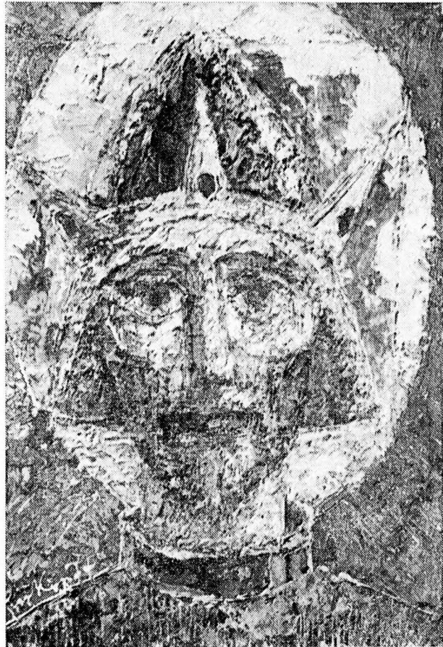
SZENT LÁSZLÓ KIRÁLY

vel ezelőtt bevezetett kötelező iskolázta- tás nélkül, ahol falusi nebulók és tanítók szorozgatva és osztogatva gyakorolták az egyszerűt és a többi alsófokú számítási műveleteket. Ezek a nagy tudósok összefüggést látnak a múlt embereinek