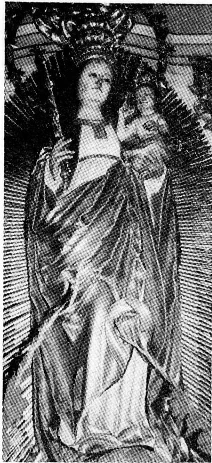
A CSÍKSOMLYÓI SZÜZ MÁRIA KEGYSZOBRA