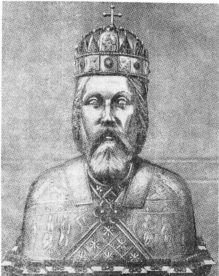
A NAGYVÁRADI SZENT LÁSZLÓ HERMA (1892)

Hogy népünk él és ma sem játssza a történelem színpadán az utolsó szerepet, ezt Isten és Szent István után neki köszönhetjük. Nemcsak testi erejének, ka-