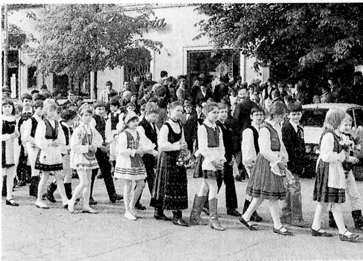
Elsőáldozók népviseletben mennek a templomba

A zarándoklatra a múltban eljötték nemcsak az ausztriai magyar hívek, ha-nem más országok magyarjai is. Szere-tettel várjuk idén is Mária-tisztelő híve -inket.