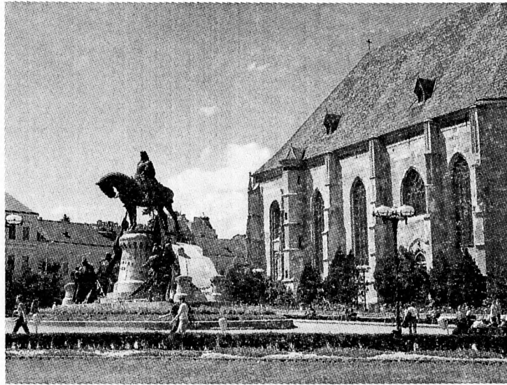
Mátyás király szobra Kolozsvárt a Szent Mihály templom déli oldalán

S ünnepelte volna az 50 évvel ezelőtt történt aktus színhelye: a kolozsvári Szent Mihály templom is. A nagy ese-ményt február 13-ra tervezték, hétfőre. Azért erre a napra, hogy a vasárnap miséző papság Erdély egész területéről mind nagyobb számban lehessen jelen. A hatóságok, akik kezdetben ugyan aka-dékoskodva, de engedélyezték a megem-lékezést, az esemény előtt néhány nap-pal megvétóztatták... A tiltó rendelke-