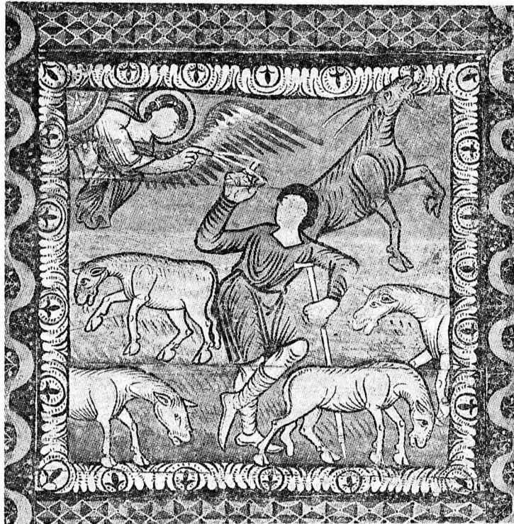
BETLEHEMI ANGYAL ÉS PÁSZTOR

Szent Márton templom, Zillis (Graubünden, Svájc)