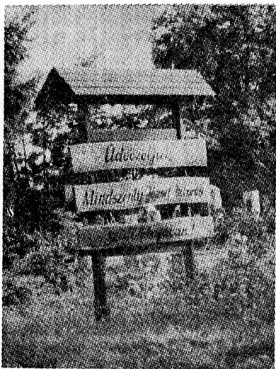
A faluba érkezőket ez a tábla köszönti: „Üdvözöljük Mindszenty bíboros szülőfalujában”.

jának. Döbörhegynek új templomában. Alig pár száz lélek összefogásából épült ez a nagyszerű Isten háza Nagyboldogasszony tiszteletére. A plébános, Rimfel Ferenc és a hívek most korunk magyar szentjeit is fel akarják festetni a falra: Batthyány Strattman Lászlót, Apor Vilmost és Mindszenty Józsefet. Társam a prédikációban megdicséri a híveket. Mindszenty bíboros példájával biztatja őket: az állhatatosság és kitartás, erős-