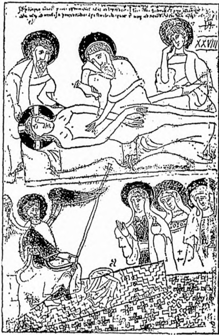
A PRAY-KÓDEX RAJZA (1192–1195)