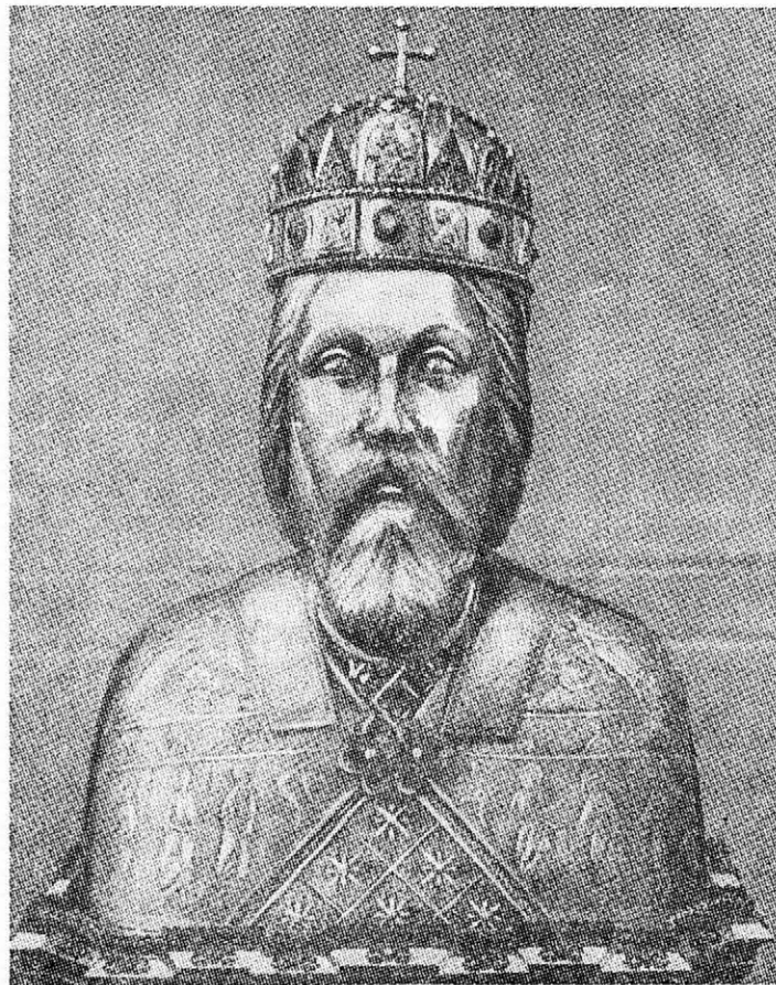
A NAGYVÁRADI SZENT LÁSZLÓ HERMA