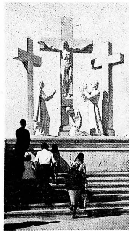
A FATIMAI KÁLVARIA MAGYAR ZARÁNDOKOKKAL

termében elénekeltük az Üdvözlés Oltárszentség-et. Nagy kegyelem volt, hogy itt lehettünk.