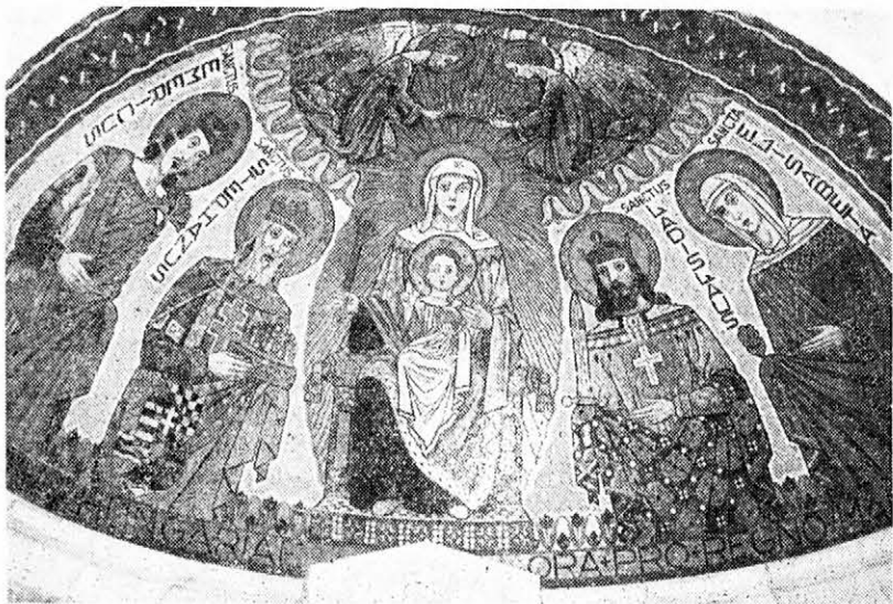
MAGYAROK NAGYASSZONYA ÁRPÁDHÁZI SZENTEKSEL Jeruzsálemben a Dormitio = Elszenderülés Bazilika magyar kápolnájának mozaikja.

Öt éjszakát töltöttünk a názáreti St. Gabriel Hotelban, amelynek ragyogó tisztaságát és ízletes konyháját, a hegytetőről nyíló pompás kilátását és főleg madárfüttyös csöndjét leginkább Jeruzsálemben, szállásunkon értékeltük. Mindjárt első éjjel 3 óra körül a muzszin baritonja ébresztett: Allah akbar! A földről az ég felé ágaskodó imádsá-