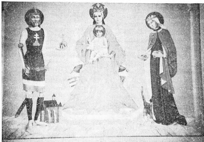
PATRONA HUNGARIAE ET BAVARIAE

A Magyar Katolikus Misszió tevékenységéről és a házában folyó munkáról 1984-től kezdődően — Cserhádi Ferenc kezdeményezésére és az ő szerkesztésében — havi Értesítő jelenik meg. Az immár 12. évfolyamánál tartó tájékoztató lap kötetének történelmi forrásér-