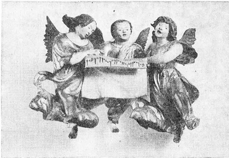
KARÁCSONYI ÉNEKLŐ ANGYALOK

4. A hála, a bűnbánat, és a hűség jellemesse tehát azt a megújulást, amit a jubileum alkalmával el akarunk határozni és meg akarunk valósítani. És még valami: Reménységgel lépni át a 2000. év küszöbét! Mindnyájunknak, az egész emberiségnek talán erre van a legnagyobb szüksége manapság. Ránk keresztényekre, és magyarokra, ez a feladat különleges súllyal nehezedik, hiszen mi tudunk bizalommal nézni a jövőbe, mert