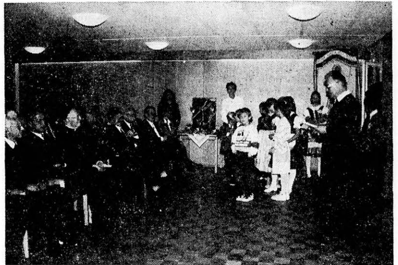
JUBILEUMI ÜNNEPSÉGEN A KATOLIKUS MISSZIÓ NAGYTERMÉBEN