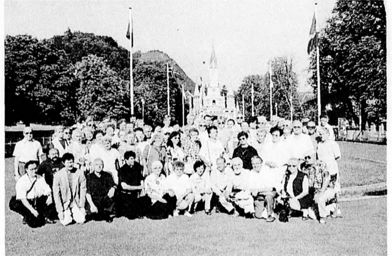
Stuttgarti zarándok csoport Lourdes-ban