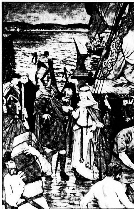
Szent Margit és kísérete Skóciába érkezik, ahol III. Malcolm, későbbi királyi férje fogadja. William Hole (1846-1917) festménye. Edinburghban a Skót Nemzeti Galéria épületében lévő freskó részlete. - Itt említjük meg, hogy Januári számunk 7. oldalán a Skóciai Szent Margitról szóló kis hírből a születési év helyesen 1045. Olvasóink elnézését kérjük. Kis ajándékkul adjuk a fenti szép képet.