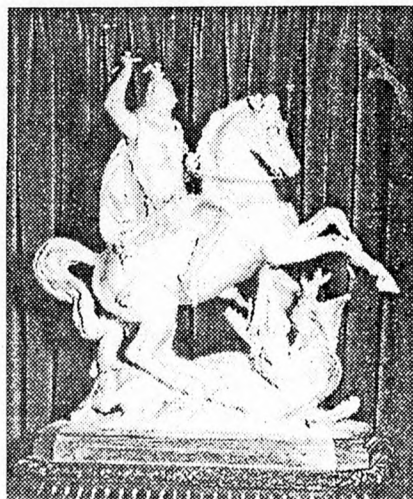
Szent György 13 kilós ezüstsobra

ezüstsobrát. Az átadáskor azonban lefagyott az arcokról a mosoly: Szent György az angolok védőszentje! S innen már csak némi elfogult következtetés kellett ahhoz, hogy némelyek a sárkányban Írországot lássák meg! Nyilvánvaló, hogy Erzsébet tanácsadói nem ismerték az ír történelmet, különben Szent Patrik szobrát javasolják, amint - a legenda szerint - egy bottal kiűzi az utolsó kígyót, vagyis angolt Írországból.