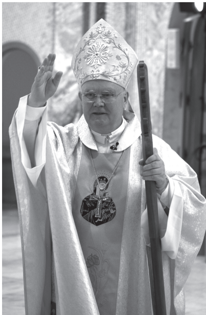
„Szakítsunk időt az elmélkedő imára, a hit elmélyítésére”

Ezzel a körlevéllel a Teremtő és az Újjáteremtő Isten erejét hirdetem: a feltámadt Krisztus győzelmét a koronavírus, a gyilkos betegségek, a bűn és a halál fölött. A Feltámadt Krisztus közelségét akarom megéreztetni mindazokkal, akik a nagy világvágy miatt most magányosan és embertársaiktól elszigetelten élnek vagy éppen elcsüggedtek és komoly megpróbáltatásokat szenvednek: az idősek, a fiatalok, a munkanélküliek, a nincstelenek, a megfertőződött betegek, vagy azok, akik éppen életük kockáztatása árán is beteg és szenvedő embertársaik szolgálatában állnak: az orvosok, az ápolók, a közellátásban dolgozók, a rendfenntartók, az önkéntesek... De az Úr közelségét szeretném megéreztetni azokkal is, akik az elmúlt években külföldre kényszerültek vagy csak éppen az idegenben akartak szerencsét próbálni, és most szeretteiktől, szüleiktől, gyermekeiktől, rokonaiktól elszakadva, valahol a nagyvilági szétszórtságban magányo-