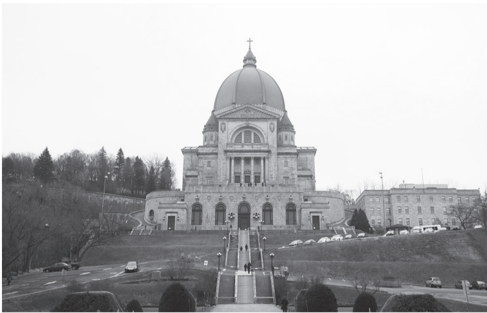
A Québec-i kegyhelyet kanadai Lourdes-nak is nevezik

Várjuk jelentkezéseiket a Józseffel a Mária-úton felhívásra. Részletek: www.eletunk.net