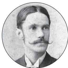
1855. április 9-én született Reviczky Gyula költő

„A vallási költészet, mely a földi ember legszentebb, legmagasztosabb érzelmeit öleli át, [...] a legfőbbeségesebb, mi után költő törekedhetik.” (Reviczky Gyula)