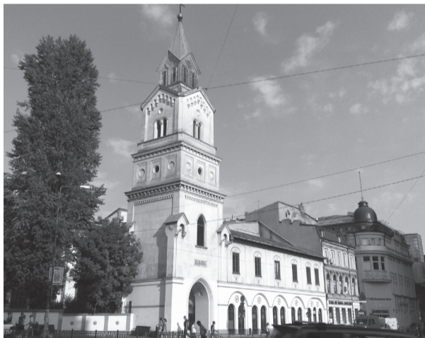
A bukaresti magyar szentmisék helyszíne

A püspök 1872–1873-ban két telket vásárolt a pályaudvar és a királyi palota közötti városrészben. A forrást a Havasalföldről 1869-ben kivonult ferencesekről az apostoli vikariátusra szállt telek eladása biztosította, de az ingatlanvásárlás és az építész díjazása kimerítette az anyagi lehetőségeket, ezért Paoli hazai és külföldi támogatók (püspökök, katolikus egyesületek, plébániák, kolostorok és magánszemélyek) megszólításába kezdett. Az építési engedélyt 1873. július 17-én kapta meg a bukaresti városházától. Személyesen kereste meg Friedrich von Schmidt neves bécsi építész, a templom stílusául pedig az olasz hazájára jellemző román stílust választotta, a keresztény Európa nagy székesegyházainak gótikus stílusával kombinálva. A templom méretei – 40 m hosszú, 20 m széles és 22 m magas – a jövőnek szóltak.