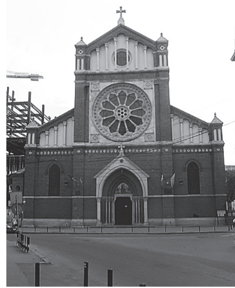
Két pápa is állt az oltáránál

és a párhuzamos mellékhajók közötti magasságkülönbség, a szentély és a szentélykörüljáró kidolgozottsága, a belső tér elosztása és a hatalmas rózsaablak.