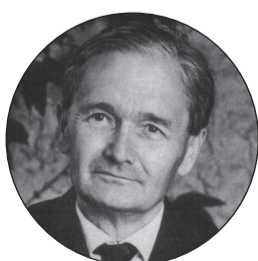
1901. április 18-án született Németh László író

„A vallási költészet, mely a földi ember legszentebb, legmagasztosabb érzelmeit öleli át, [...] a legfőbbeségesebb, mi után költő törekedhetik.” (Reviczky Gyula)