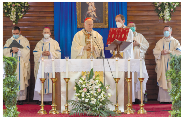
Erdő Péter: Szűz Mária anyai szeretete erőforrás számunkra