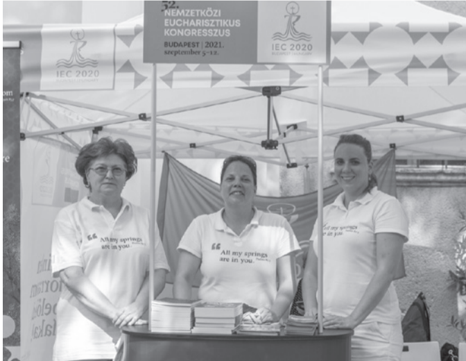
Találkozunk szeptemberben Budapesten!