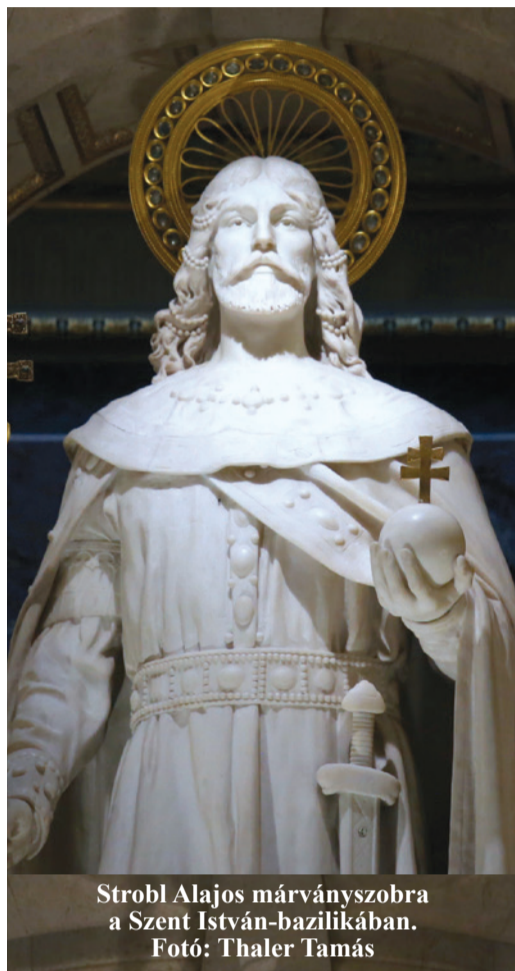
Strobl Alajos márványszobra a Szent István-bazilikában.