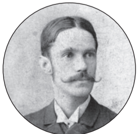
1889. július 11-én halt meg Reviczky Gyula költő