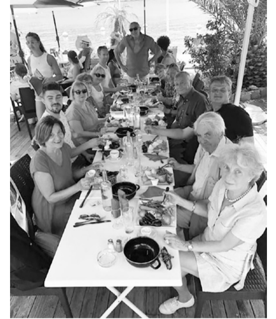
Az asztalnál is hangulatos és imádságos volt az együttlét

Zarándoklatunk utolsó állomása és méltó befejezése a katakombáiról nevezetes Szent Viktor-kolostor lett. Itt a Salve Regina imával búcsúztunk az első keresztények szent helyétől.