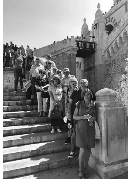
A Notre Dame de la Garde-bazilika lépcsőjén

hagymás, majonézes szószot, amely kiválóan illik a kagylókkal, kisebb rákokkal és zöldségfélékkel megrakott tálakhoz. Ebéd után