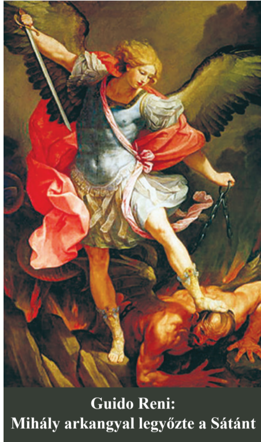
Guido Reni: Mihály arkangyal legyőzte a Sátánt

Július 26-án az edmontoni Commonwealth Stadionban mutatott be szentmisét Ferenc pápa, mintegy 50 ezer hívő előtt. Szent Anna liturgikus emléknapiján a nagyszülők fontosságára hívta fel a figyelmet. Múltunk gyökerei ők, identitásunk megalapozói, akiktől tanulhatunk, akikre vigyáznunk kell és együtt építeni egy békés jövőt, hogy soha ne ismétlődjön meg az őslakosok elleni erőszak és kirekesztés. A Szentatya délután igeliturgiát vezetett Észak-Amerika őslakosainak egyik legszentebb helyén, a Szent Anna-tónál, amely régóta gyógyító helyként ismert. Homíliájában ott is azt emelte ki, hogy az őslakos népek és a nagyszülők az Egyház értékes kincsei. (Forrás: Vatikáni Rádió)