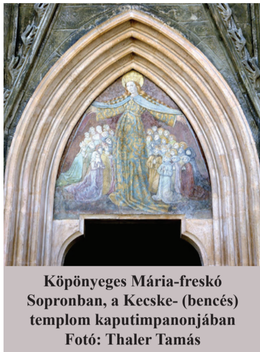
Köpenyeges Mária-freskó Sopronban, a Kecse- (bencés) templom kaputimpanonjában

Novák Katalin a Vatikáni Rádióban stúdióbeszélgetésben számolt be a Szentatya-