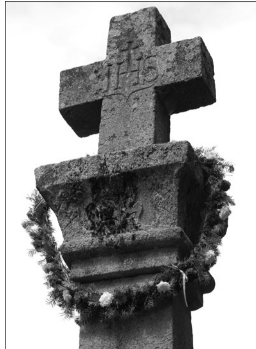
Kőkereszt Csíksomlyón, a Salvator-kápolna előtt.