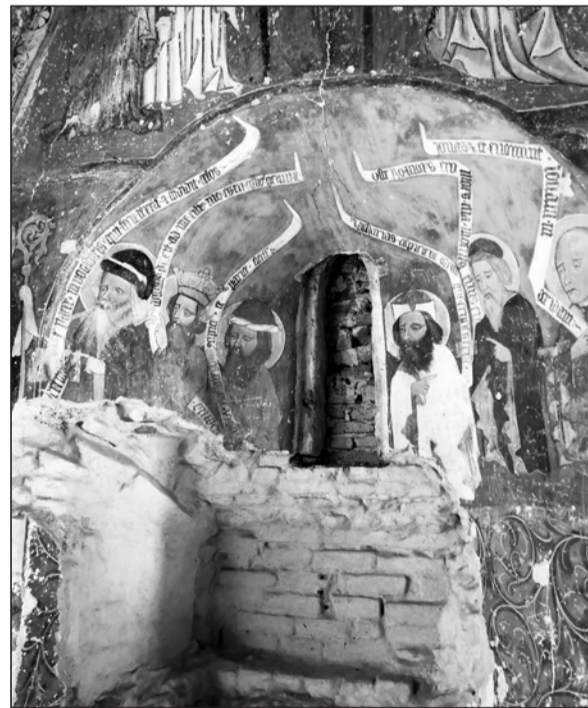
Tizenötödik századi freskók a szászhermányi kápolnában.