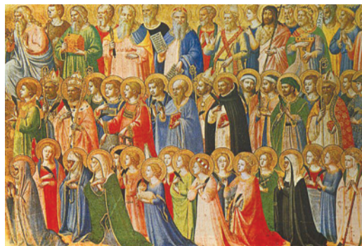
Fra Angelico: Krisztus előfutárai szentekkel és mártírokkal (1423–1424)