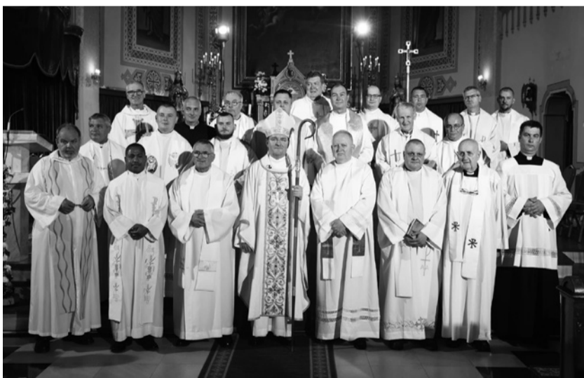
A Nagybecskereki Egyházmegye papsága új főpásztorával

Szerkesztette: Varga Gabriella