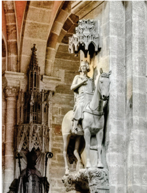
Bambergi lovas (1225). A hagyomány szerint Szent István királyról mintázták.

Hallgassanak el a fegyverek, szűnjön meg az eszkaláció! Párbeszédre és tárgyalásra van szükség – hangzott a pápa újabb felhívása a háborúban lévő nemzetek vezetőihez június 2-án. Az Úrangyala elimádkozása után Ferenc pápa arra kérte a Szent Péter téren összegyűlt híveket, hogy imádkozzanak Szudánért, ahol a több mint egy éve tartó háborúra még mindig nem találtak békés megoldást. Hallgassanak el a fegyverek! A helyi hatóságok és a nemzetközi közösség elkötelezettségével segítsenek a lakosságnak és a sok kitelepítettnek. A szudáni menekülteket fogadják be és védelmezzék a szomszédos országokban – hangzott a pápa felhívása. A Szentatya újból felemelte szavát a meggyötört Ukrajna, Palesztina, Izrael és Mianmar érdekében, majd az érintett országok kormányzóinak bölcsességében bízva arra kérte őket, hogy szüntessék be az eszkalációt, és tegyenek meg minden erőfeszítést a párbeszéd és a tárgyalás érdekében.