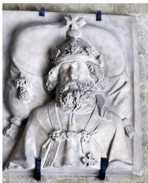
Szent Henrik középkori domborműve a róla elnevezett prágai templomban.

pökség is missziós rendeltetésű volt. A terület ugyanis névlegesen már régen keresztény volt, azonban a püspöki székhely túl messze volt ahhoz, hogy a püspök igazán törődhesen a hívekkel. Henriknek hosszú tárgyalások során sikerült rávennie a würzburgi püspököt, hogy mondjon le a területéről és ezzel tegye lehetővé egy új püspökség alapítását. 1007. november 1-jén végre sor kerülhetett a regnitzai püspökség megalapítására, amely-