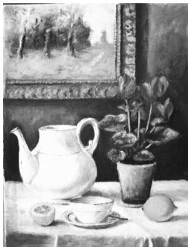
Bulcsú Piroska: Ciklámenes csendélet