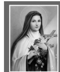
Kis Szent Teréz