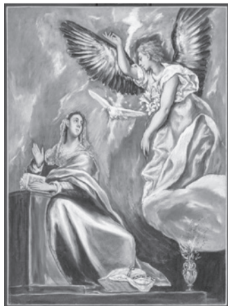
El Greco: Angyal üdvözlés (Forrás: romkat.ro)