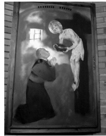
Udvardi Erzsébet: Devictus vincit (Legyőzve győz)