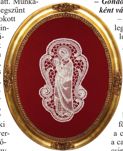
Madonna a Kisdeddel

– Ha valaki a csipkére gondol, a lelki szemei előtt valami könnyű, finom, puha, különleges, légiesség jelenik meg. A csipke készítése, de még inkább a viselete sokkal nőiesebb teszi a