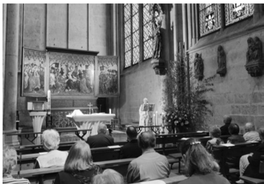
Szentmise a kölni dóm Mária-oltáránál