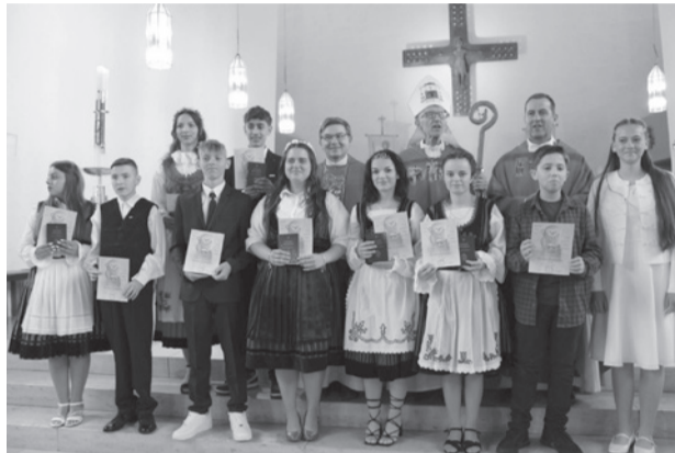
A bérmálkozók is tudják: „Az ünnep az élet rangja, felsőbb értelme” (Márai Sándor).