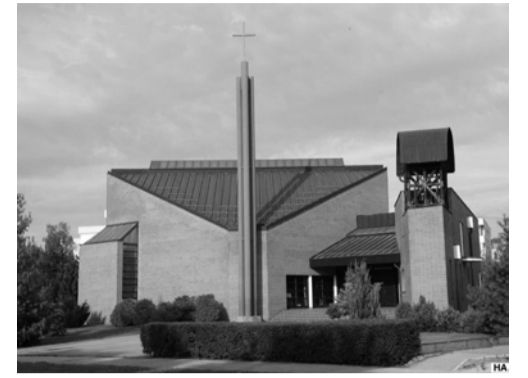
A Mindszenty-emléktemplom Veszprémben

ért áldozott a vörös istentelenség ellen vívott hősi küzdelemben. Egyháznak, államnak ő mutatta a helyes utat ” – olvasták fel az alapkö mellett elhelyezett okiratot.