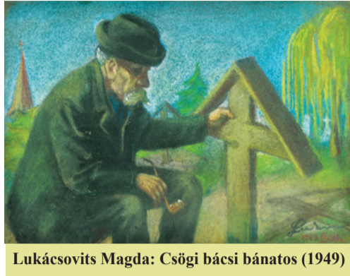
Lukácsovits Magda: Csögi bácsi bánatos (1949)

XIV. Leó pápa is megemlékezett Mureșan bíborosnak az üldöztetés idején tanúsított példamutató tanúságtételéről. „Imádkozom ennek a jó és figyelmes szolgának a lelkéért, aki mottójához hűen még a szenvedésben is fel tudta áldozni életét és bizalommal rábízta magát a Mennyei Atyára” – írta részvétváltatásában. A Cristian Dumitru Crișan fogaras-gyulafehérvári görögkatolikus segédpüspöknek, valamint a romániai görögkatolikus egyház püspöki karának címzett üzenetében a Szentatya kifejezte közelségét a görögkatolikus egyház papjaihoz és híveikhez – akiknek a bíboros „atyja és vezetője” volt –, valamint az elhunyt családtagjaihoz és mindazokhoz, akik gyászolják halálát. „Hálát adok Istennek az egyház ezen hűsé-