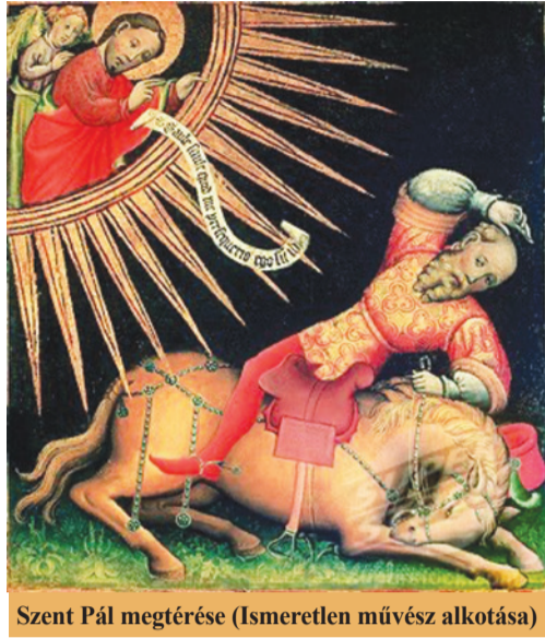
Szent Pál megtérése (Ismeretlen művész alkotása)

Végül azt kérte, hogy a Béke Világnapján mindnyájan együtt imádkozzunk a békéért. Mindenekelőtt imádkozzunk a konfliktusok és nyomor miatt vérző nemzetek közötti békéért, de otthonaink békéjéért is, az erőszak és a fájdalom által szedett családok békéjéért. Annak képét a bizonyosságában, hogy Krisztus, a mi reménységünk az igazságosság soha ki nem alvó napja, bizalommal kérjük Mária, Isten Anyja és az egyház Anyja közbenjárását – fejezte be fohászával beszédét XIV. Leó pápa. (Forrás: Vatican News)