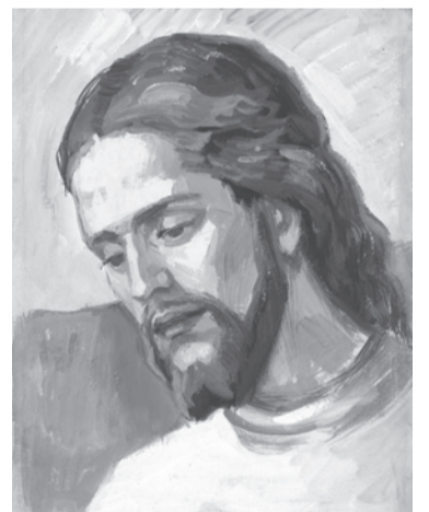
Jézus (Dés, 1960)

egy festményhez a Szentírás szavait is (üzenőszalag formájában) hozzácsatolva. Munkásságát az oltárrendezések teljesítették ki és ez még szorosabb kötődést alakított ki közöttük és katolikus egyházunk között. A diktatúra évtizedeiben elszántan teljesítette küldetését, és folytatta ezt a szabadság korában is, Európa keletebbi és nyugatabbi felén egyaránt. Önarcképével és Jézus-arcképével idézzük emlékezetünkbe rögzös életútját, a Magyar Kultúra Napján különösen tisztelgünk az értékmentés és a szakrális alkotás iránti elkötelezettsége előtt, nagybőjt idején pedig elmélyedünk képsorozataiban, amelyek elcsendesedésre és imára hívnak. (VG)