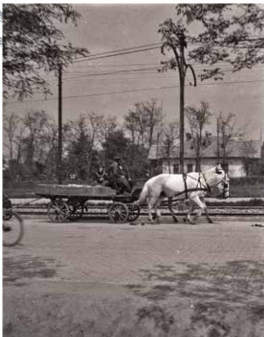
Az Üllői út keramittal a Kossuth térnél, 1938 körül

Az Üllőre vezető országút, illetve a négyes számú főközlekedési útvonal vármegye által karbantartott és tisztított burkolata sok bosszúságot okozott egykor a közlekedőknek, a mellette lakóknak, illetve Pest-szentlőrinc vezetésének. Nyolcvanhét évvel ezelőtt aztán úgy tűnt, hogy megtalálták a városi ranghoz méltó, ideális megoldást: 1936. november 12-én elkészült az impozáns sárga, fényes keramitburkolat. A gépjárműforgalom növekedésével azonban a csúszós keramitot aszfalttal kellett felváltani.