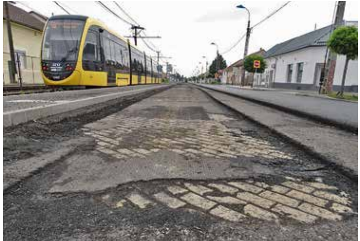
A keramitburkolat az Üllői út felújításakor – 2023. szeptember 3.

A próbaborkolatok közül a Rendessytelepnél betonlapokból épített szakasz már két év alatt annyira elhasználódott, hogy javítás után homokaszfalttal kellett borítani. A Biehn cég burkolata sem bírta a nagy forgalmat, így 1930-ban ezt a szakaszt is jó minőségű homokaszfalttal burkolták.