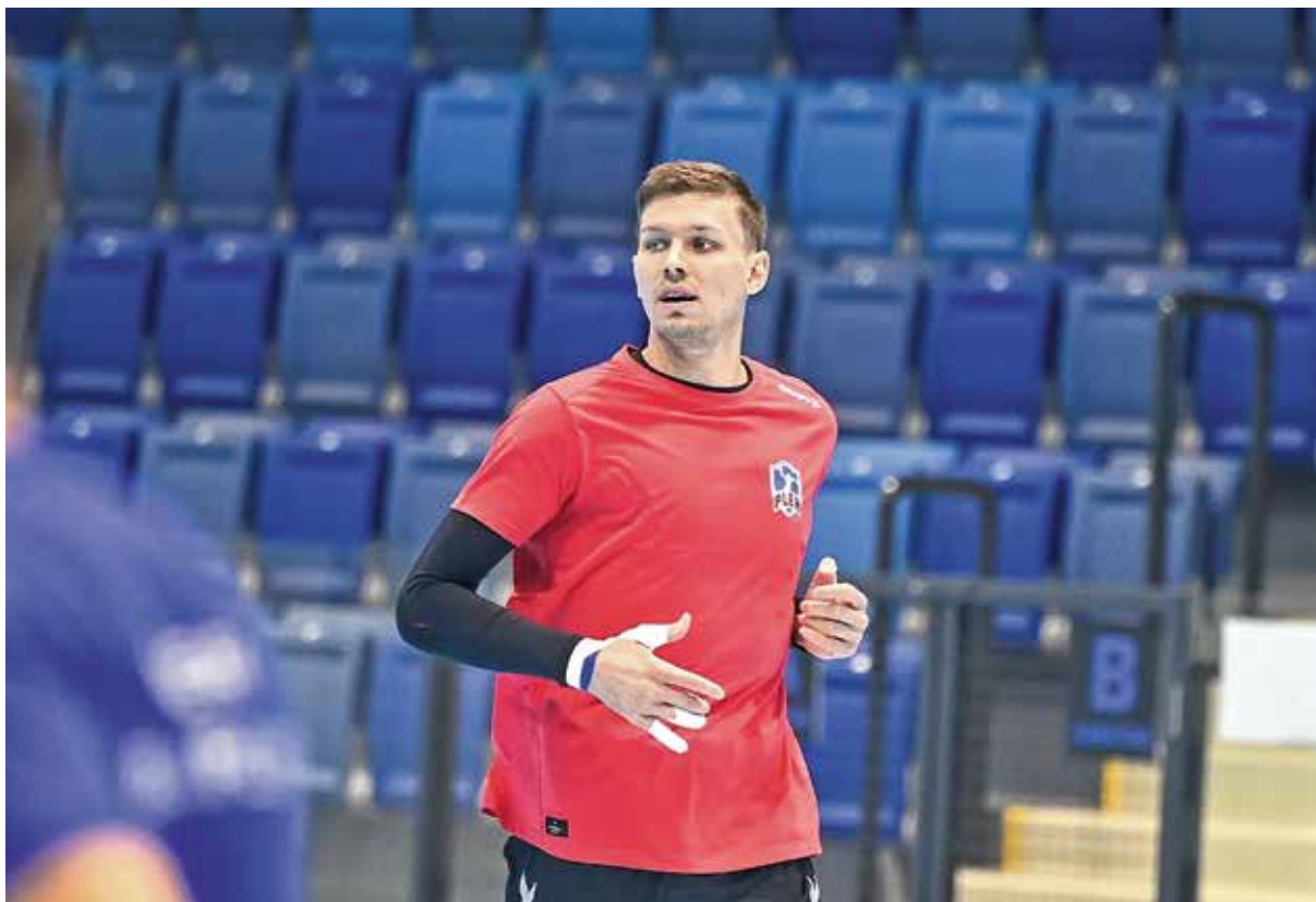
Világsztár edz a BUD Arénában