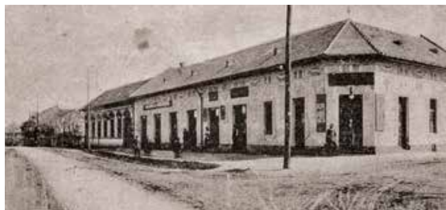
Az Üllői út a Szarvas csárdánál, 1912