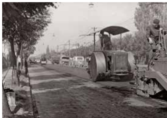
A keramit burkolása a Németh József utcánál, 1964 körül