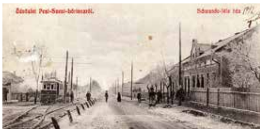
Az Üllői út a Ráday utcánál a villamos-végállomással, 1912