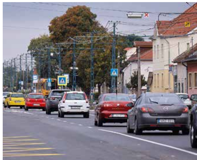
Megindult a forgalom a felújított útszakaszon