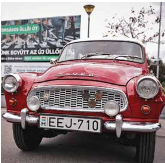
Régi autó új úton

Visszakapták a kerületiek és a térségből Budapestre érkező közlekedők az Üllői út felújított szakaszát. Az ünnepélyes átadáson a főpolgármester és a XVIII. kerület polgármestere megajándékozta egymást az Üllői út egy-egy korábbi időszakból, de más-más korból származó burkolati kövével.