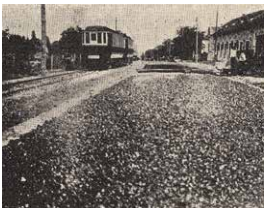
Makadámút készítése a Szarvas csárdánál, 1926

Az Üllőre vezető országút, illetve a négyes számú főközlekedési útvonal vármegye által karbantartott és tisztított burkolata sok bosszúságot okozott egykor a közlekedőknek, a mellette lakóknak, illetve Pest-szentlőrinc vezetésének. Nyolcvanhét évvel ezelőtt aztán úgy tűnt, hogy megtalálták a városi ranghoz méltó, ideális megoldást: 1936. november 12-én elkészült az impozáns sárga, fényes keramitburkolat. A gépjárműforgalom növekedésével azonban a csúszós keramitot aszfalttal kellett felváltani.