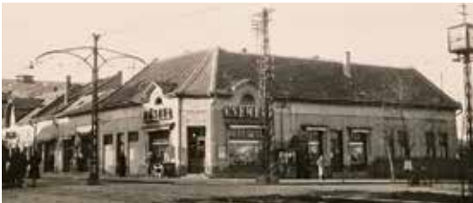
Az Üllői út a Ráday utcánál, 1957