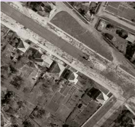
Munkások dolgoznak a Gyergyó utcánál, 1965. május 4. (fentrol.hu)

1936. január 1-jén Pestszentlőrinc városi rangra emelkedett, viszont a tél folyamán az Üllői út állapota nagyon leromlott, hatalmas lyukak keletkeztek rajta, ezért Wimmerth Béla plébános kérte az út kijavítását. Júliustól hat kilométer hosszan 2,7 millió keramitkockát raktak le, és kiszélesítették az úttestet. Az új Üllői utat 1936. november 12-én adták át. Ezzel a munkával eltűntek az árkok, a kerékvető, és megkezdődött a járdaépítés.