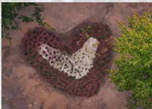
Szív alakú esőkert a Tomory kertjében

Nyílt napon mutatták be a Tomory Lajos Múzeum kertjében épített 34 négyzetméteres esőkertet, amellyel heves esőzésnél a Bókay-kertből a kertkapun át bezúduló esővizet kívánják helyben a talajba szikkasztani, miközben hosszú távon megtartják a nedvességet a növényzet számára.