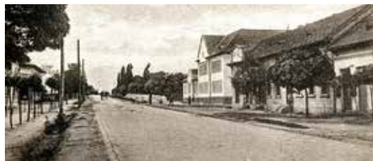
Az Üllői út makadámmal a Gulner Gyula utcánál, 1928