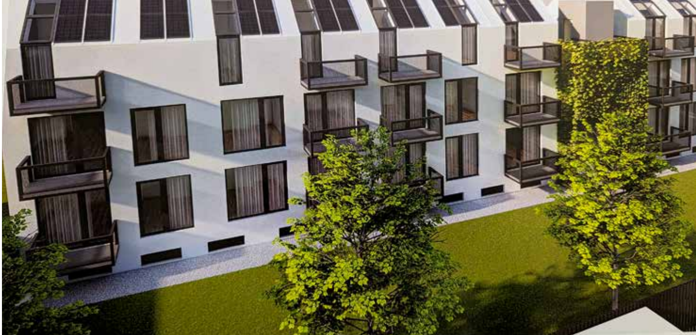
Az épülő ház látványterve