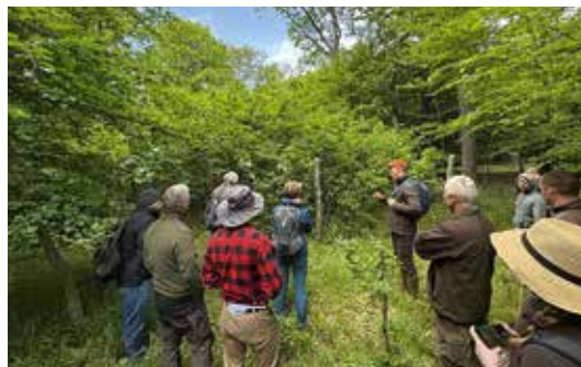
Húsz éve ültetett „újjulatot” mutat be az igazgatóhelyettes

Ez év tavaszán lakossági tiltakozás bontakozott ki, mert a Péterhalmi-erdőben levő „teaház” környéki tölgyes számos egyedül kivágandóként jelölték meg a Pilisi Parkerdő Zrt. szakemberei az évek óta tartó Városierdő-fejlesztési Program kapcsán. Egyes lakosok erdőirtás, tarvágás, gazdasági célú fakitermelés és természetkárosítás miatt fújtak riadót. Lássuk, mi is az igazság.