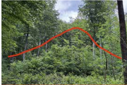
Megújuló erdőrészlet egy 15 éves nyiladékkban