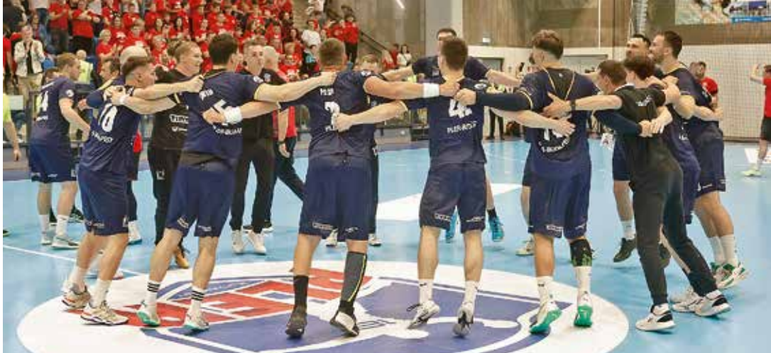
Ünnepel a csapat...