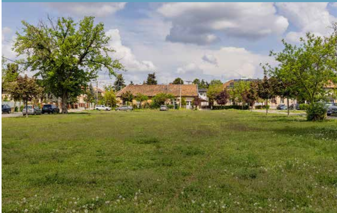
Az Üllői úti telek

Mint azt a polgármestertől megtudtuk, voltak ezek között megfontolandó indítványok is. Ilyen volt például egy-egy ötlet az értékesítésre szánt ingatlanok közül néhánynak az esetleges további hasznosítására.