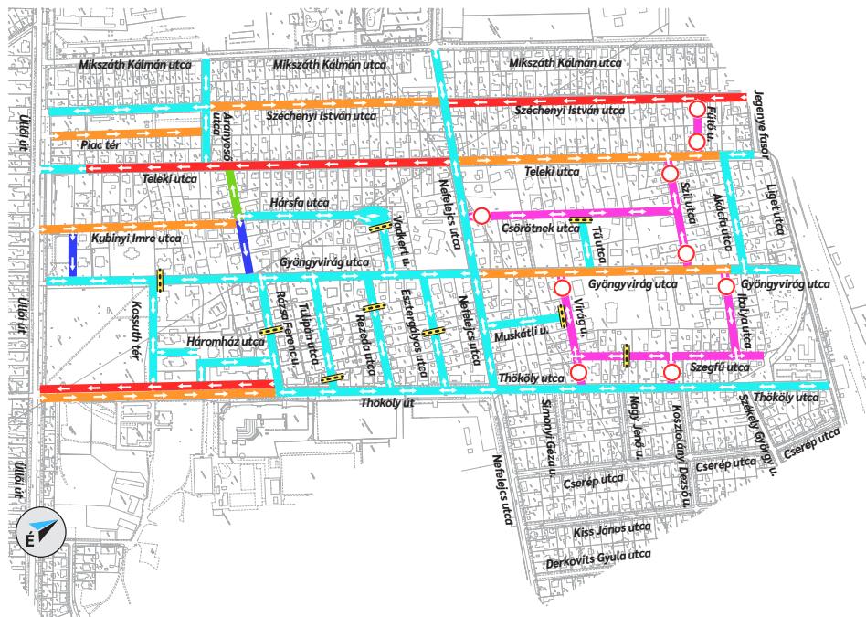
A tervezett forgalmi változások Pestszentlőrincen