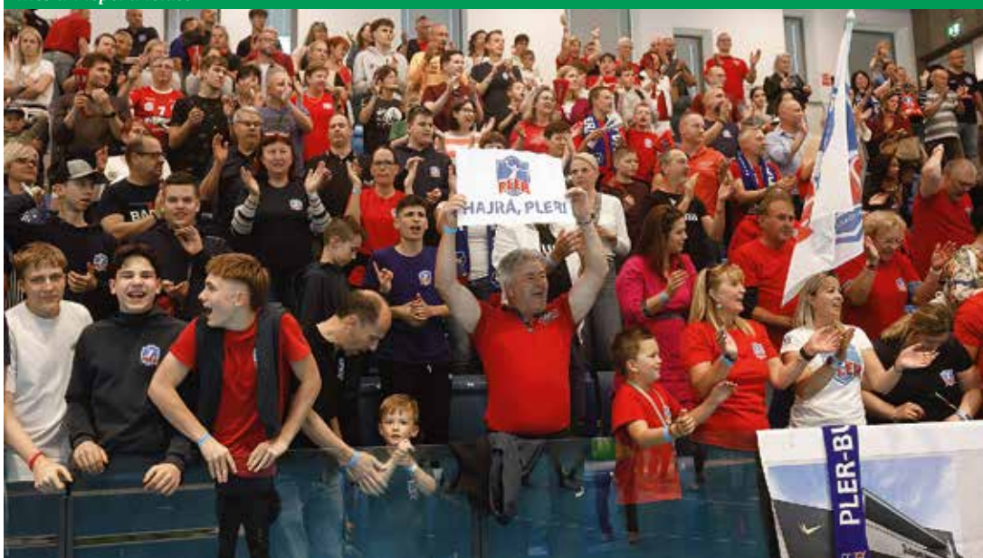
...és ünnepel a lelátó

– Egyszer s mindenkorra tisztáztuk, hogy mit jelent az, ha valaki a PLER mezét viseli. Tudatosítottam a srácokban, hogy mennyi minden múlik ezen