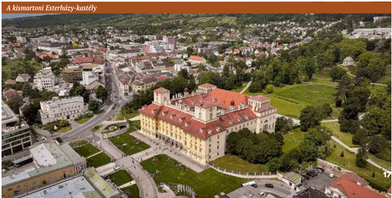
A kismartoni Esterházy-kastély