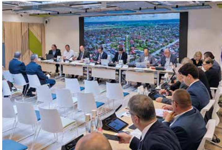
A testület megszavazta

mények szerint lakáshoz juthatnak az érintettek. Az elképzelések szerint ötévente cserélődnek majd a bérlők, ennek megfelelően mindig újabb fiatalok költözhetnek be és kezdenek el az önálló életet. A beruházáshoz szükséges anyagi forrást az önkormányzat nem használt ingatlanjainak pályázat útján történő értékesítéséből kívánja előteremteni.