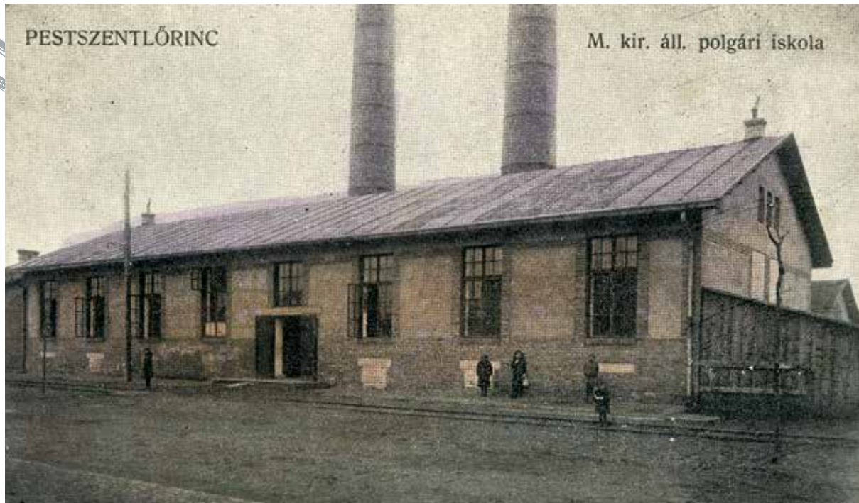
A polgári iskola épülete az Állami lakótelepen

A református vallású székely nemesi családból származó Zöld Sándor a háromszéki Illyefalván született 1862-ben. Kolozsváron tanítói, majd Budapesten matematika szakos polgári iskolai tanári képesítést szerzett. 1883-tól 1905-ig a baróti polgári fiúiskola tanára volt, ahol a református egy-