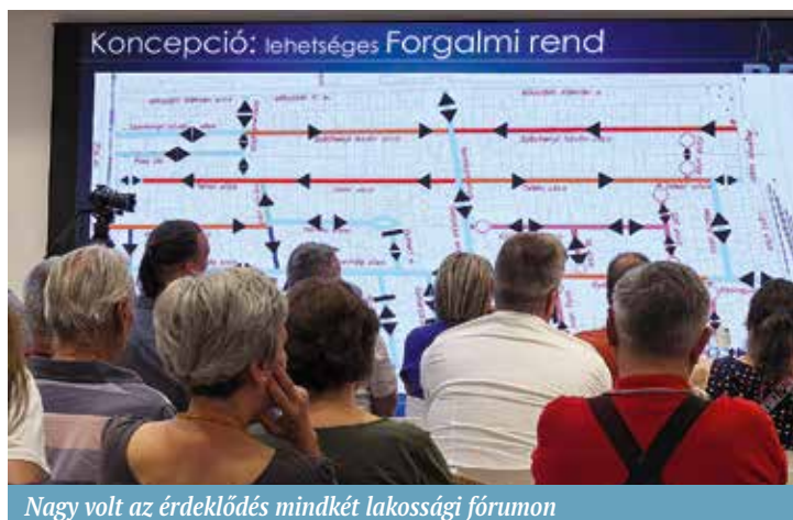
Nagy volt az érdeklődés mindkét lakossági fórumon